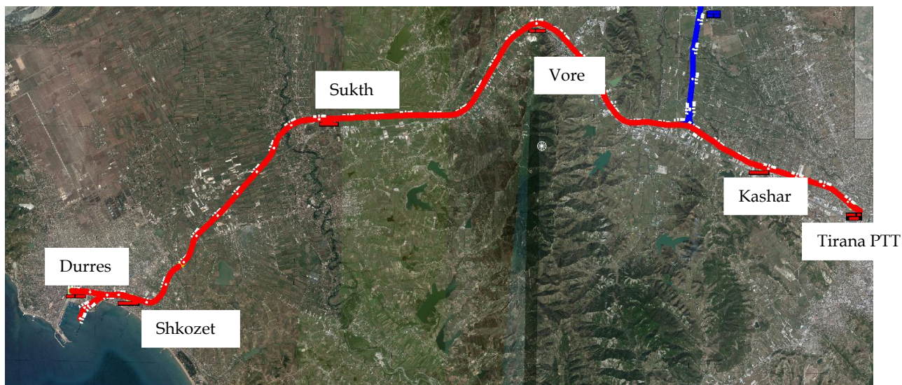
Figura 1. Linja Hekurudhore Tirana –Durrës (vija e kuqe)